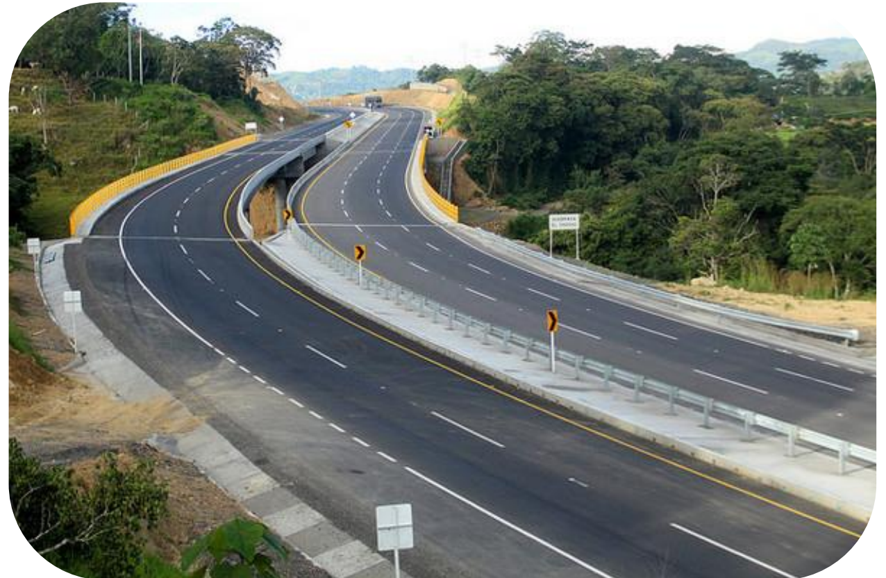
Concesión La Pintada