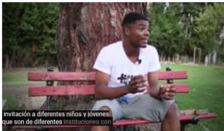
Invitación a diferentes niños y jóvenes que son de diferentes Instituciones con